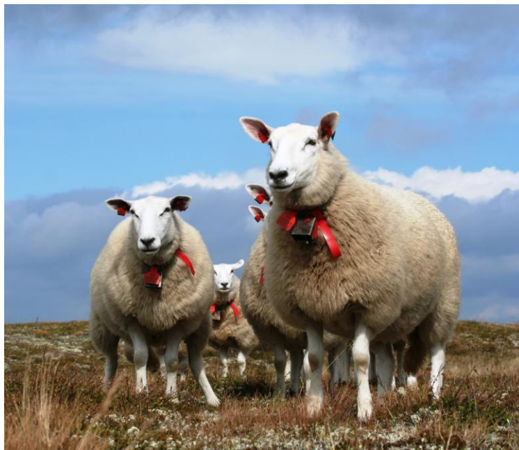
Sau på fjellbeite (Foto: M. Blom).

Det er gått 25 år siden atomkraftulykken i Tsjernobyl, men fortsatt er det radioaktivitet igjen i norsk natur. Det radioaktive stoffet cesium-137 tas opp av plater og sopp og overføres til dyr på utmarksbeite. I beitesesongen 2010 måtte 20 000 sau på nedfôring for å redusere radioaktivitetsnivået i kjøttet før slakting. Oppland hadde flest sauer på nedfôring med nesten 12 000 sauer. Totalt ble det utbetalt 2,2 millioner kroner i erstatning til dyreeiere i 2010. I perioden 1986–2010 er ca 2,2 millioner sau blitt nedfôret med en kostnad på ca 227 millioner kroner.