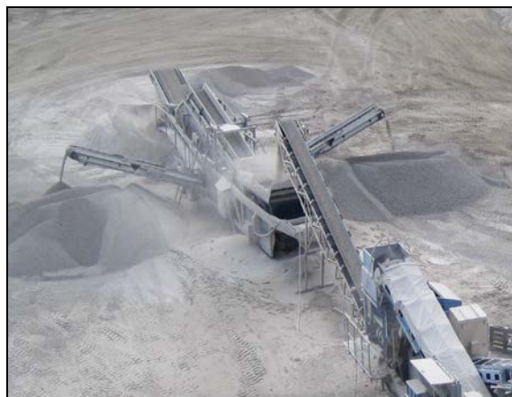
Produsenter av pukk bør dokumentere konsentrasjonen av radium eller uran.

Les mer om radon på www.nrpa.no og www.ngu.no .