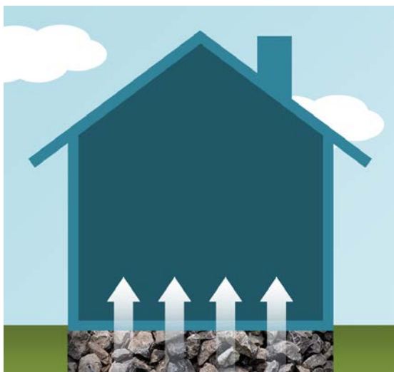
Illustrasjon: Strålevernet/Mari Komperød.

Statens strålevern anbefaler at pukk og andre tilkjørte masser under og rundt bygninger har dokumentert lave konsentrasjoner av radium og uran. Mye radium og uran i disse massene kan føre til høy konsentrasjon av radon i bygget.