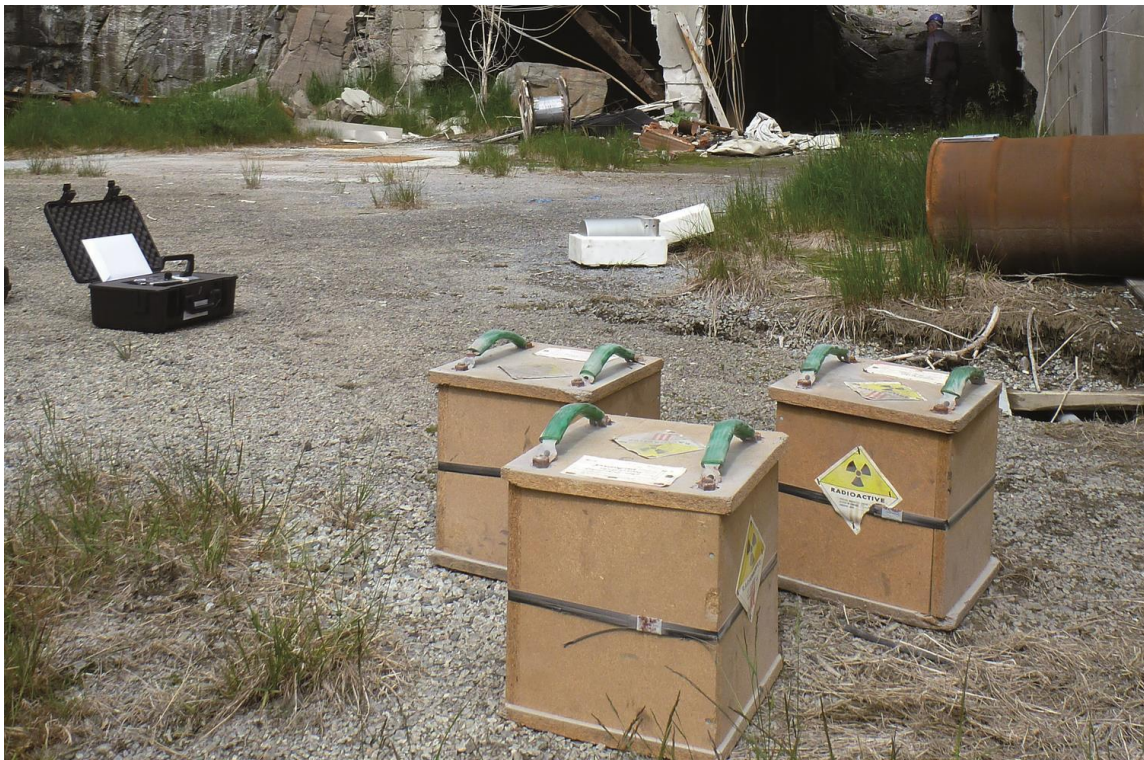
Strålekilder på avveier er ett eksempel på en hendelse i scenario 4.

Eksempler er langvarige utslipp fra kjernekraftanlegg eller andre anlegg for behandling eller lagring av radioaktivt materiale, strålekilder på avveier eller bruk av radioaktivt materiale i terrorøymed. Noen tidligere eksempler er strålekilde på avveier i Goiânia i Brasil i 1987, strålekilder på avveier i Mayapuri i New Delhi i India i 2010 og forgiftningen av Alexander Litvinenko i London i 2006.