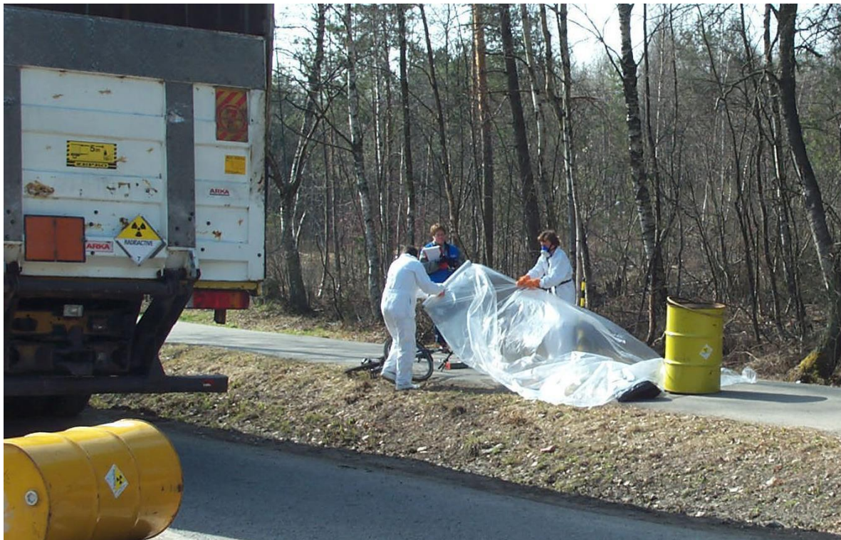
Ett eksempel på en hendelse i scenario 3 er uhell under transport av radioaktivt materiale langs vei.

Eksempler er hendelse med reaktordrevet fartøy eller transport av radioaktivt materiale et sted utenfor norskysten med utslipp til luft. Andre eksempler er styrt av satellitt med radioaktivt materiale om bord, uhell under transport av radioaktivt materiale med fly eller langs vei, hendelser med strålekilder i bruk, strålekilder på avveier som dukker opp eller bruk av radioaktivt materiale i terrorøymed.