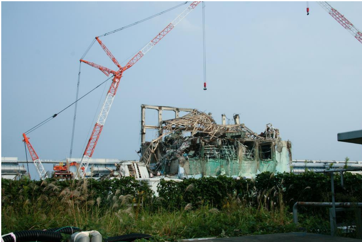
Kjernekraftverket Fukushima Dai-ichi. Et eksempel på en hendelse ved kjernekraftanlegg i utlandet som ikke berører norsk territorium.

Norske statsborgere og interesser kan bli berørt av bruk av kjernevåpen i utlandet.