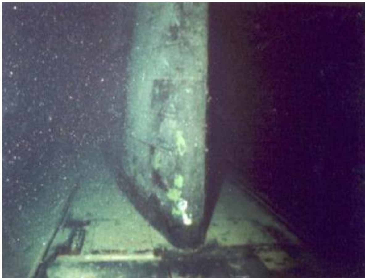
Den sunkne atomubåten Komsomolets er ett eksempel på en hendelse i scenario 5.

Eksempler er små utslipp til luft eller alvorlige utslipp til marint miljø fra reaktordrevne fartøy eller skipstransport av radioaktivt materiale i havområder i nærheten av Norge, eller lignende utslipp fra kjernekraftanlegg eller andre anlegg for behandling eller lagring av radioaktivt materiale. Noen tidligere tilfeller er forlisene av de russiske reaktordrevne ubåtene Komsomolets i 1989, Kursk i 2000 og K-159 i 2003.