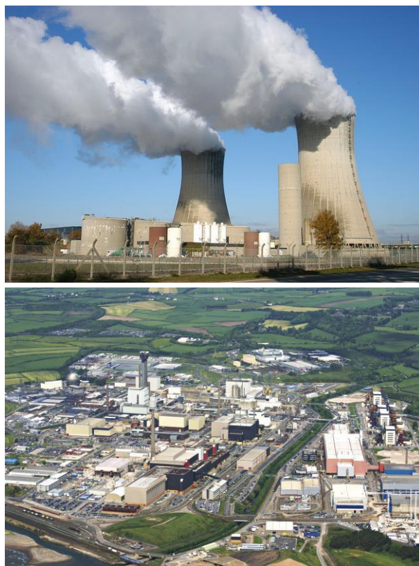
Eksempler på hendelser i scenario 1 er Tsjernobyl-ulykken i 1986, mulige fremtidige hendelser ved kjernekraftverk i vår del av verden, og ved avfallslagre og behandlingsanlegg i Sellafield.