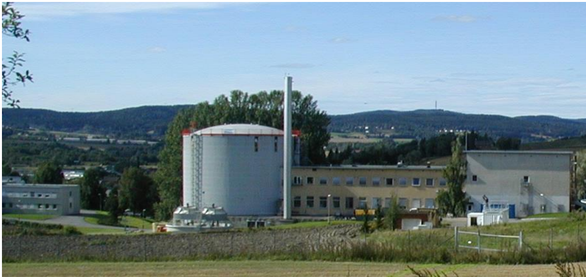
Forskningsreaktoren på Kjeller.

Eksempler på slike hendelser kan være ulykker/hendelser på en reaktordrevet ubåt som ligger til havn i Norge, eller ved en av forskningsreaktorene på Kjeller eller i Halden.