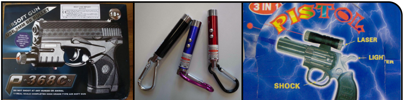
Dette er eksempler på laserpekere som ikke er merket slik de skal.