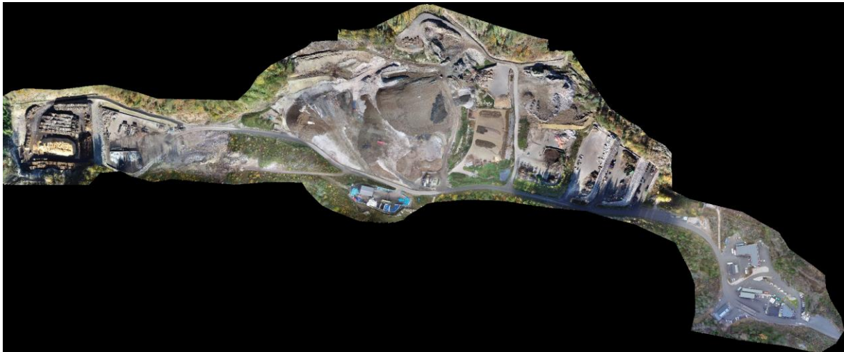
Bilde 1: Oversiktsbilde: Venstre side = Nord, Høyre side = Sør