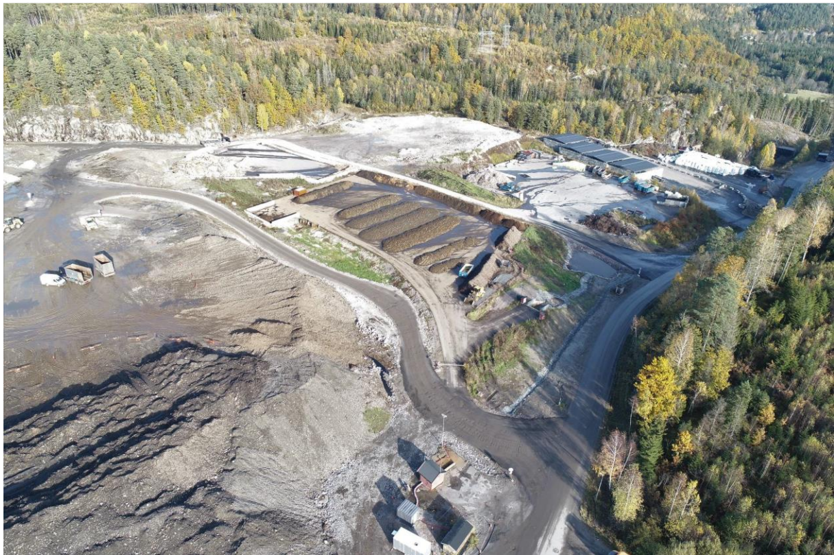
Bilde 4: Deler av deponiområde og arbeidsflater for gjenvinning