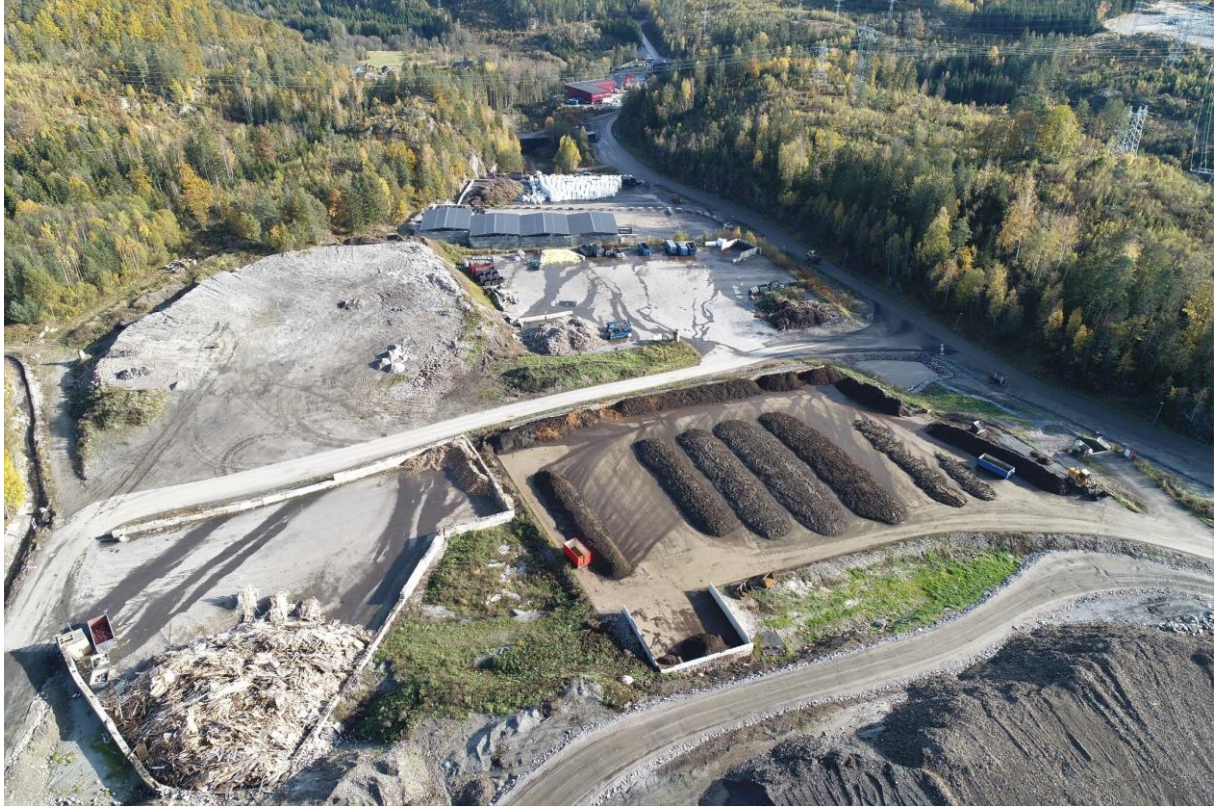
Bilde 3: Bilde tatt fra deponikant mot sør: Flater for gjenvinning og administrasjonsområde.