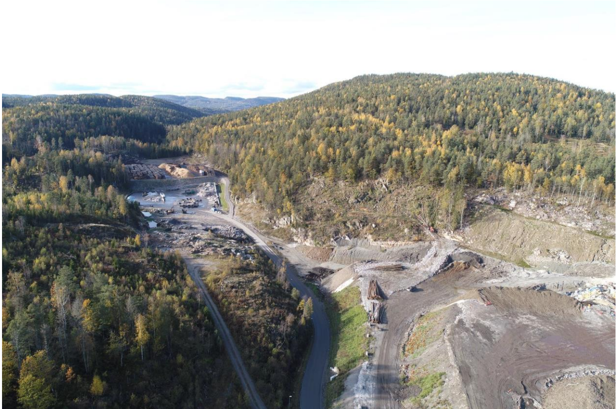
Bilde 5: Bilde fra deponiområde mot nord og plate for sortering av restavfall (Bjorstadmyra)