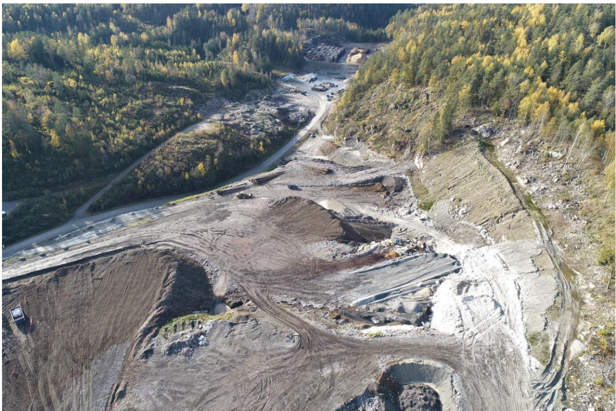
Bilde 6: Nedre del av deponi. Aktuell område for deponering av fosfatsand midt i bildet.